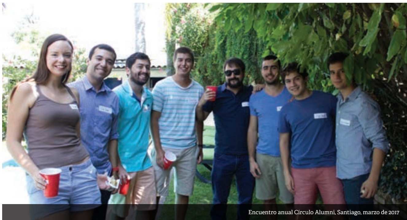
Encuentro anual Círculo Alumni, Santiago, marzo de 2017