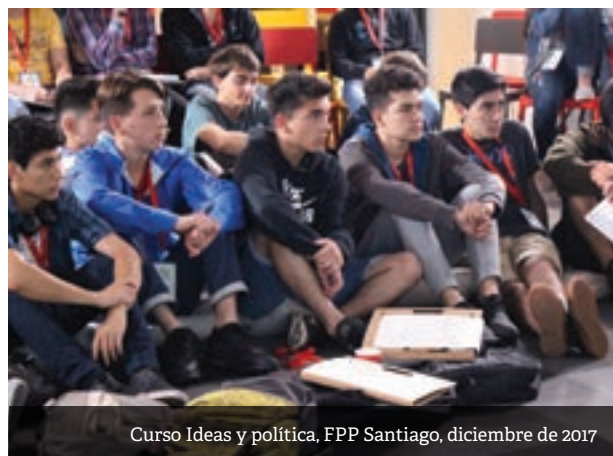
Curso Ideas y política, FPP Santiago, diciembre de 2017