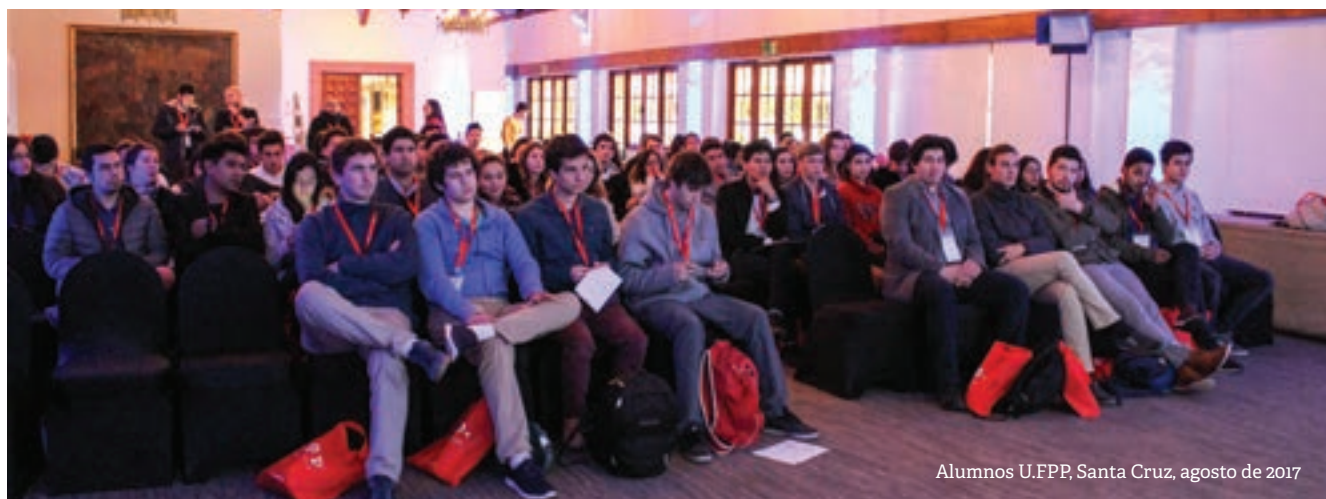
Alumnos U.F.P.P. Santa Cruz, agosto de 2017