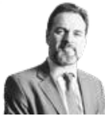
NIALL FERGUSON (Glasgow, 1964)

En 2017 FPP contó con la incorporación a su equipo asesor del destacado historiador británico como Miembro Honorario, esto implica que la fundación contará con su apoyo, guía y consejos para las decisiones que deba tomar. Para la fundación es un gran aporte contar en sus filas con uno de los académicos e intelectuales públicos más influyentes del mundo en este momento.