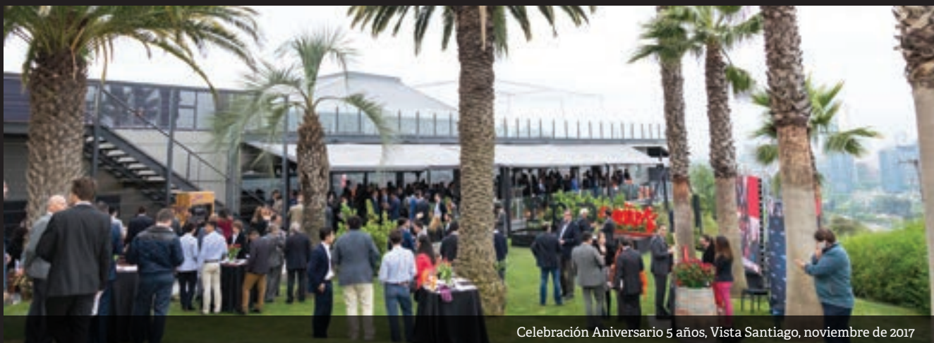
Celebración Aniversario 5 años, Vista Santiago, noviembre de 2017