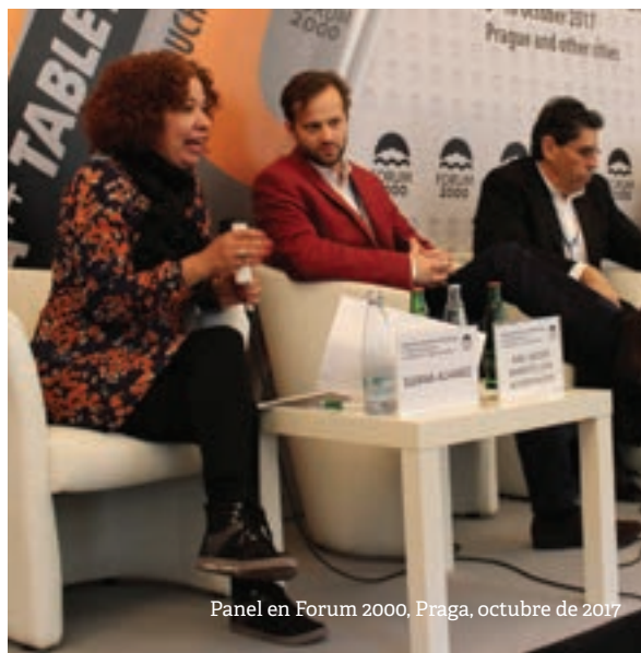
Panel en Forum 2000, Praga, octubre de 2017