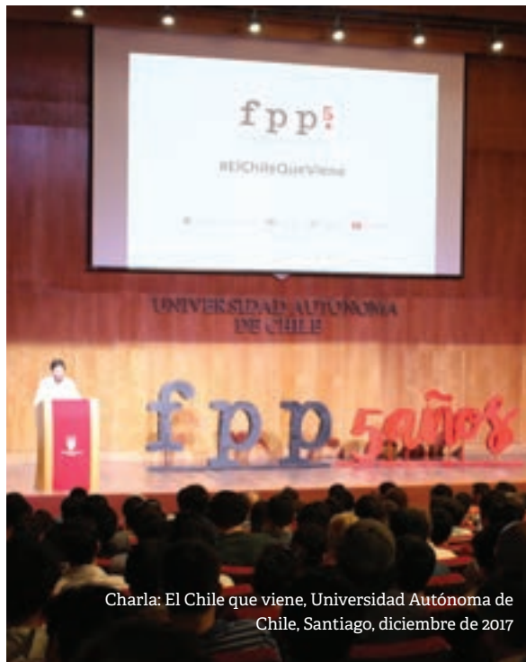
Charla: El Chile que viene, Universidad Autónoma de Chile, Santiago, diciembre de 2017