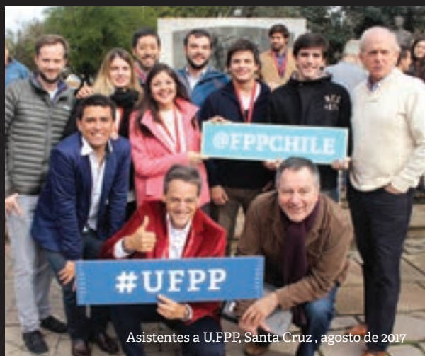
Asistentes a U.FPP, Santa Cruz , agosto de 2017