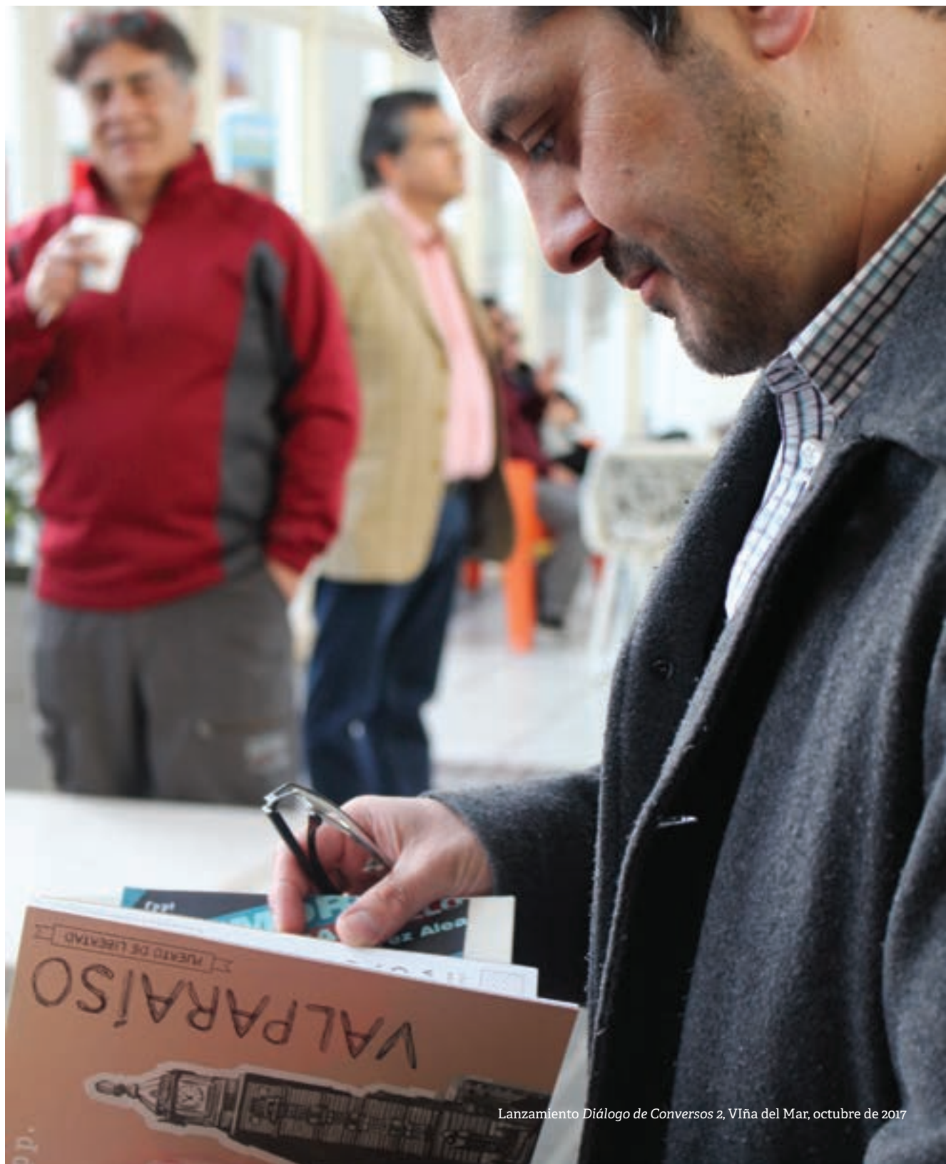
Lanzamiento Diálogo de Conversos 2 , Viña del Mar, octubre de 2017