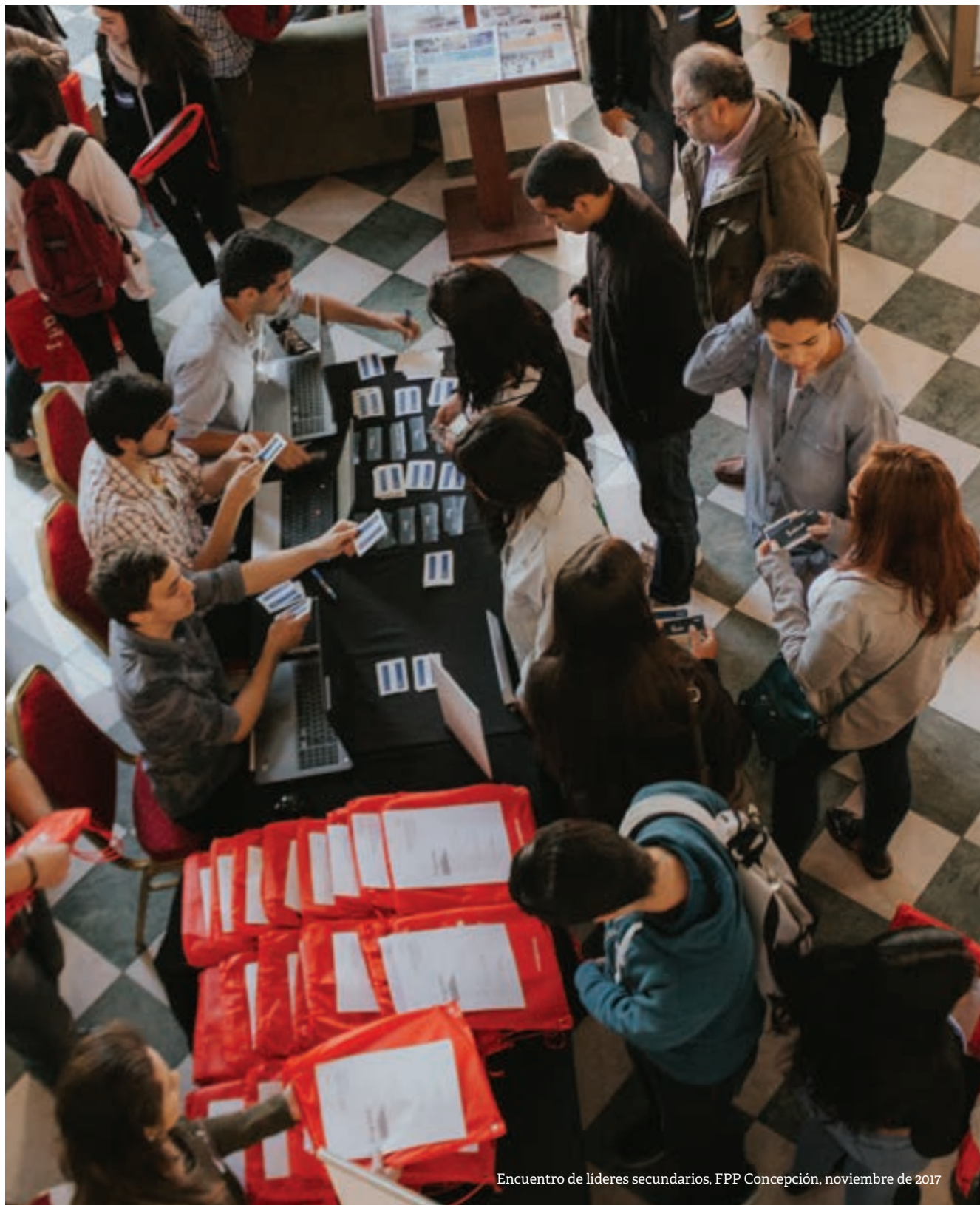
Encuentro de líderes secundarios, FPP Concepción, noviembre de 2017