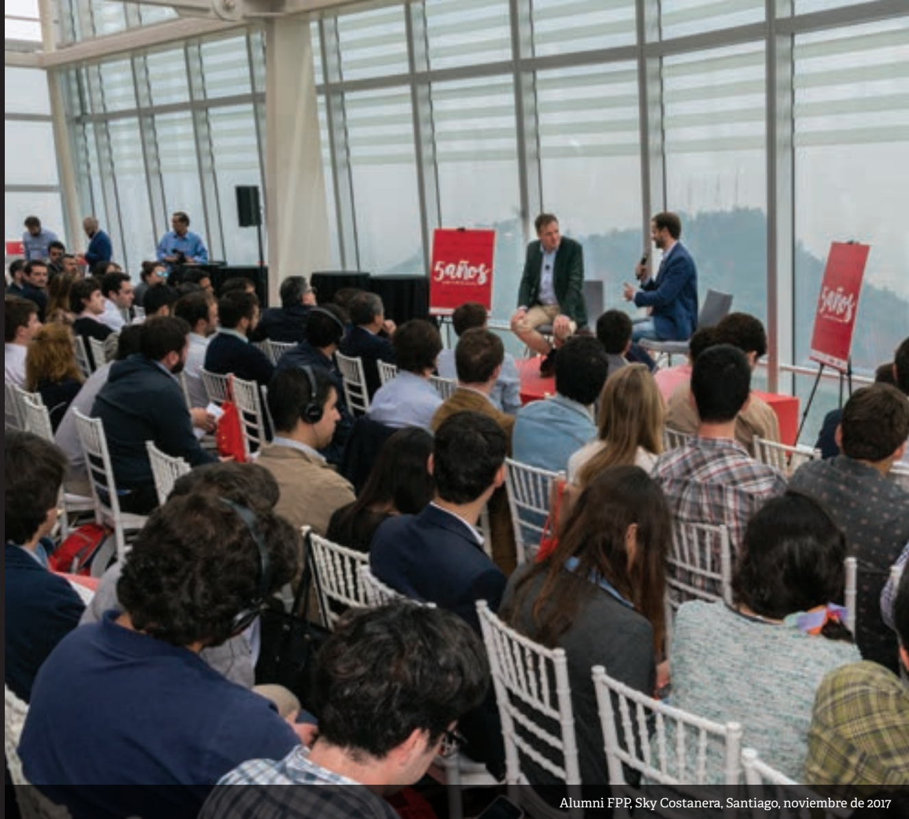
Alumni FPP, Sky Costanera, Santiago, noviembre de 2017

En su visita a Chile Niall Ferguson participó de varias actividades con los seguidores y amigos de FPP: