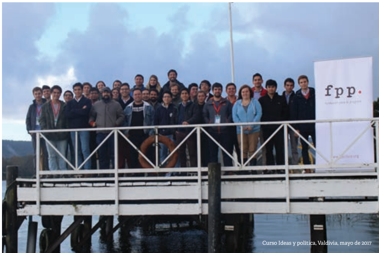
Curso Ideas y política, Valdivia, mayo de 2017