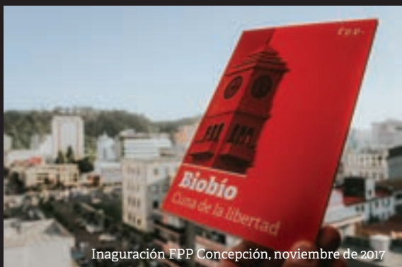
Inauguración FPP Concepción, noviembre de 2017

El jueves 30 de noviembre se inauguraron las nuevas oficinas de FPP en Concepción, ubicadas en Tucapel N° 564, piso 10, oficina N°101. En este encuentro participaron jóvenes, académicos, emprendedores locales, miembros del Directorio de FPP, los Senior Fellows, parte del Círculo de Fundadores de Concepción, miembros del Círculo Alumni y el equipo FPP.