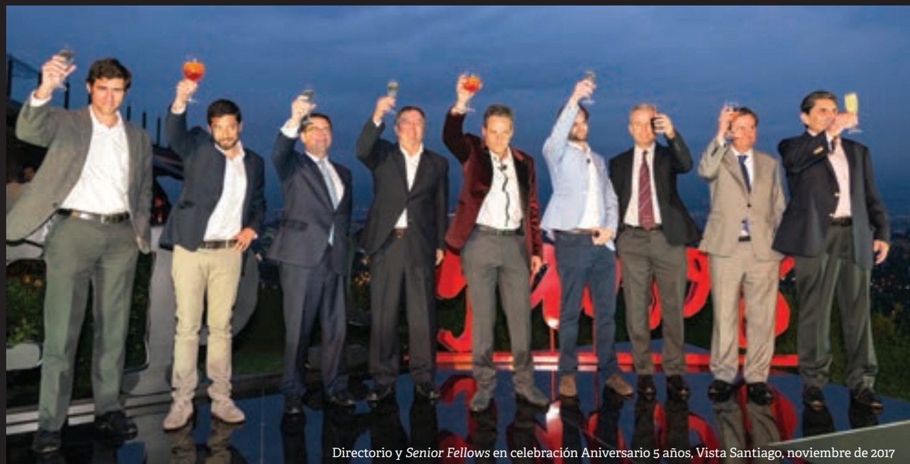
Directorio y Senior Fellows en celebración Aniversario 5 años, Vista Santiago, noviembre de 2017