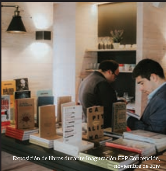
Exposición de libros durante Inauguración FPP Concepción, noviembre de 2017