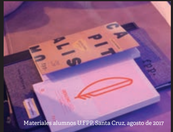
Materiales alumnos U.FPP, Santa Cruz, agosto de 2017