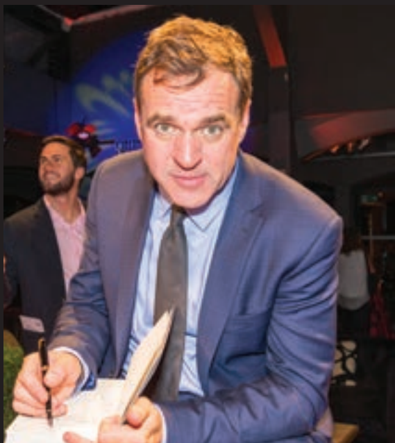
Niall Ferguson en celebración Aniversario 5 años FPP. Vista Santiago, noviembre de 2017

Para la celebración de nuestros primeros cinco años nos visitó nuestro miembro honorario, Niall Ferguson, historiador británico reconocido por la revista Time en 2014 como uno de los 100 personajes más influyentes del mundo. Es Senior Fellow en Hoover Institution de Stanford University y en el Center for European Studies de Harvard.