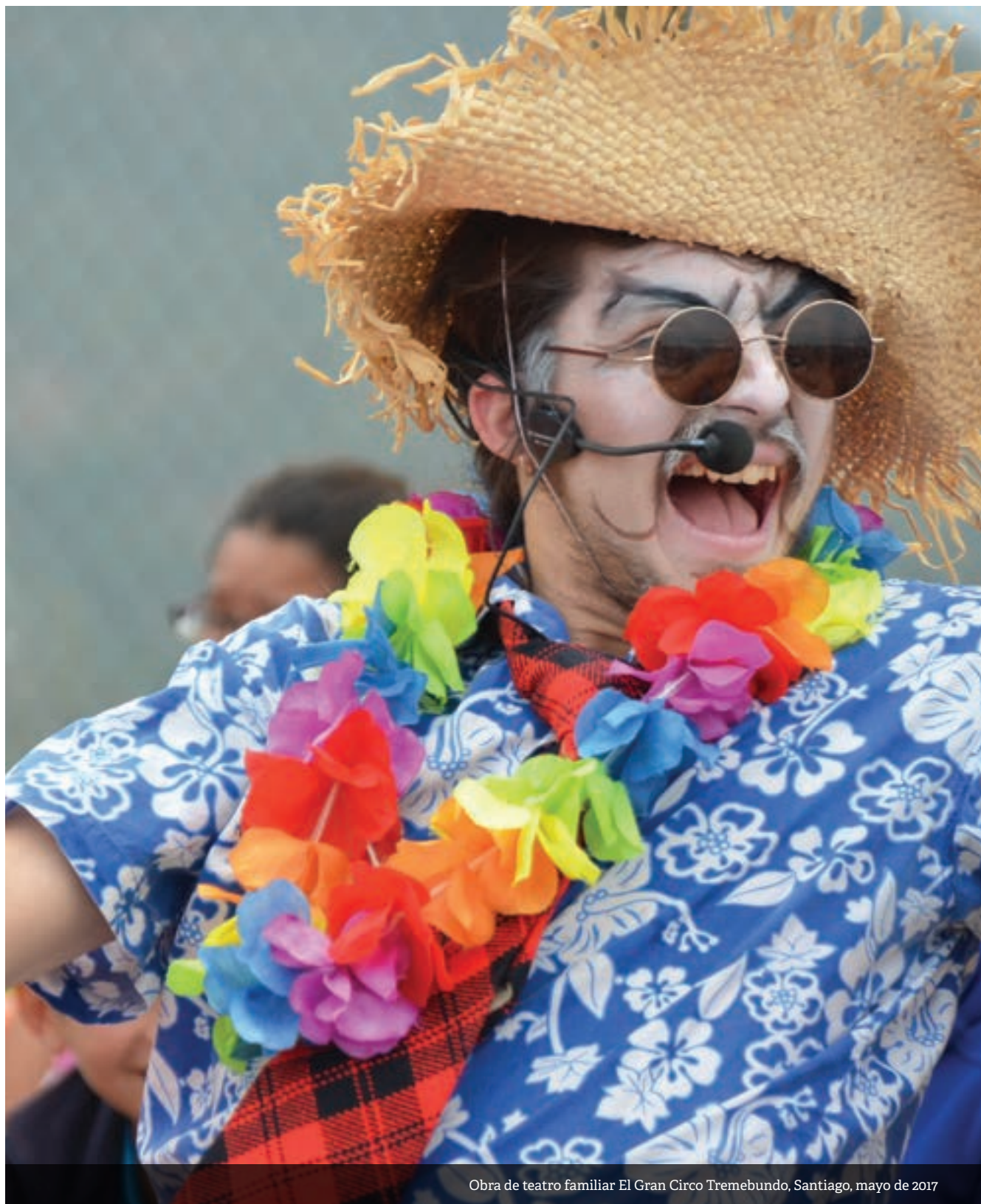
Obra de teatro familiar El Gran Circo Tremebundo, Santiago, mayo de 2017