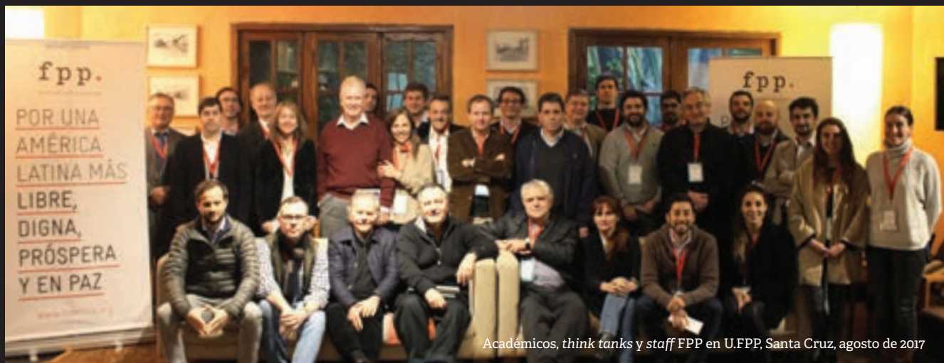
Académicos, think tanks y staff FPP en U.FPP, Santa Cruz, agosto de 2017