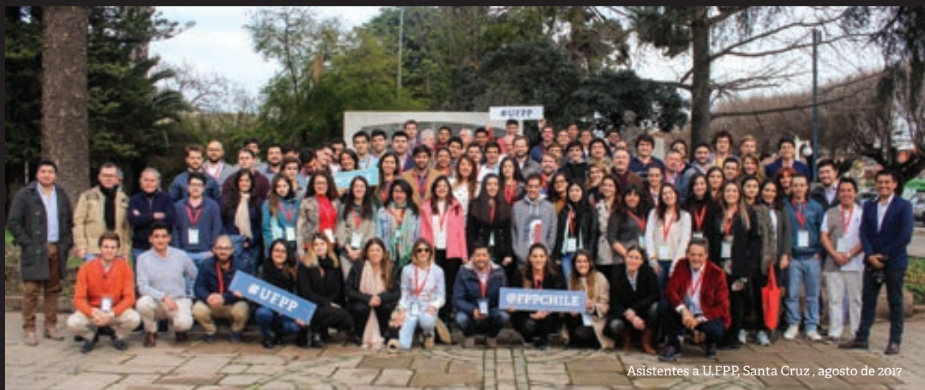
Asistentes a U.FPP, Santa Cruz , agosto de 2017