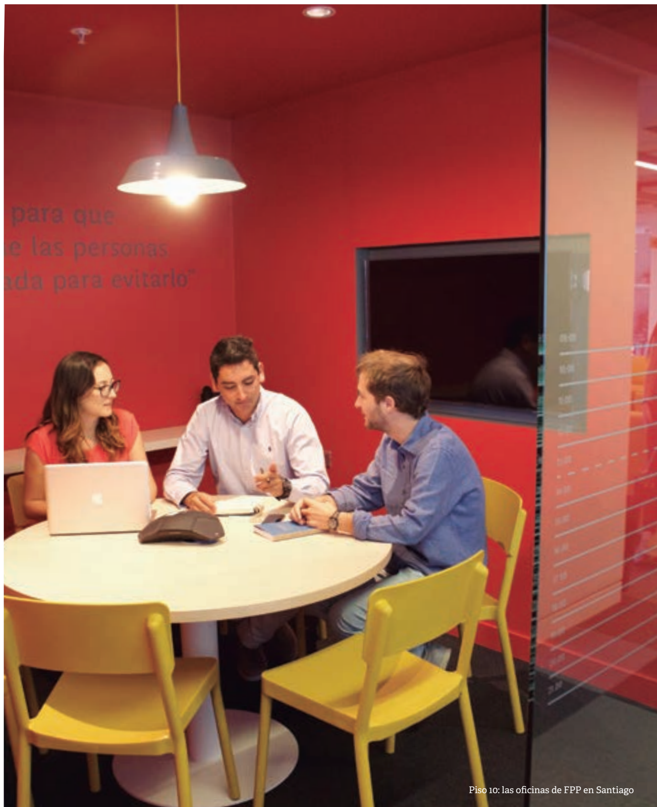
Piso 10: las oficinas de FPP en Santiago