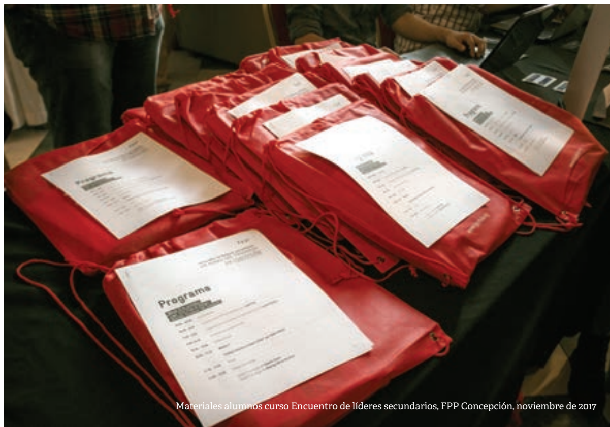
Materiales alumnos curso Encuentro de líderes secundarios, FPP Concepción, noviembre de 2017