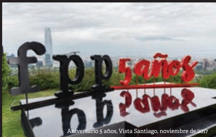
Aniversario 5 años, Vista Santiago, noviembre de 2017