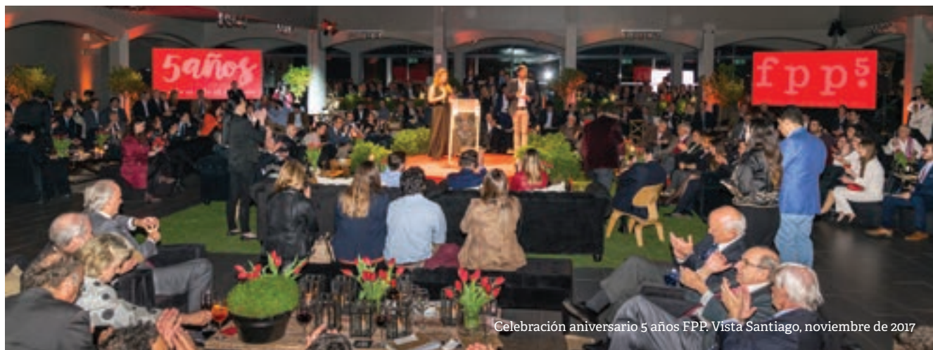
Celebración aniversario 5 años FPP. Vista Santiago, noviembre de 2017