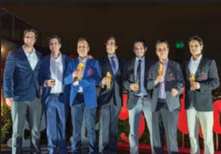
Miembros del Círculo Alumni en celebración Aniversario 5 años, Vista Santiago, noviembre de 2017