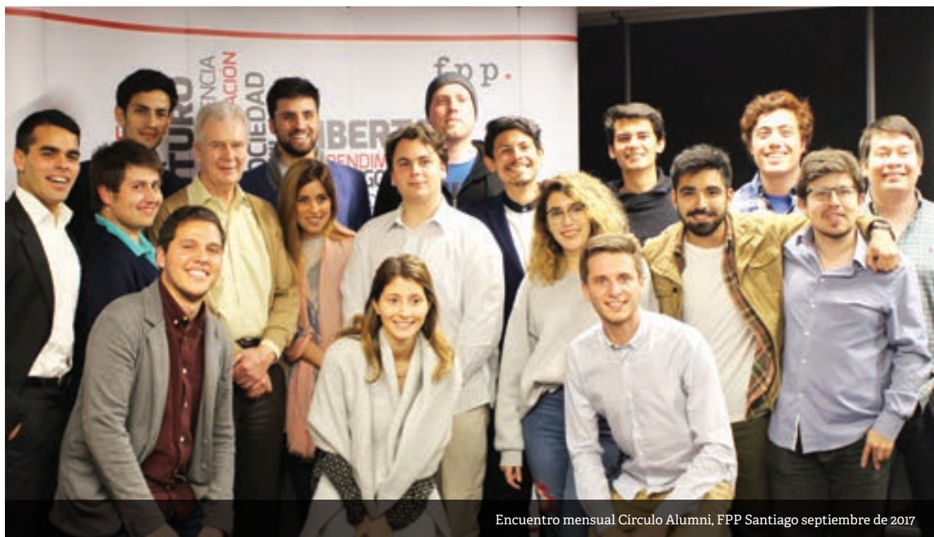
Encuentro mensual Círculo Alumni, FPP Santiago septiembre de 2017