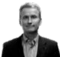
DAG VON APPEN B. Vicepresidente del Directorio FPP