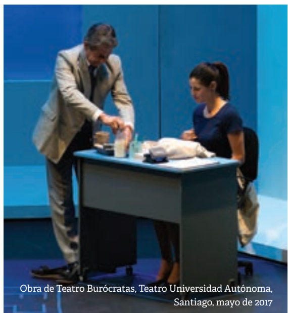
Obra de Teatro Burócratas, Teatro Universidad Autónoma, Santiago, mayo de 2017