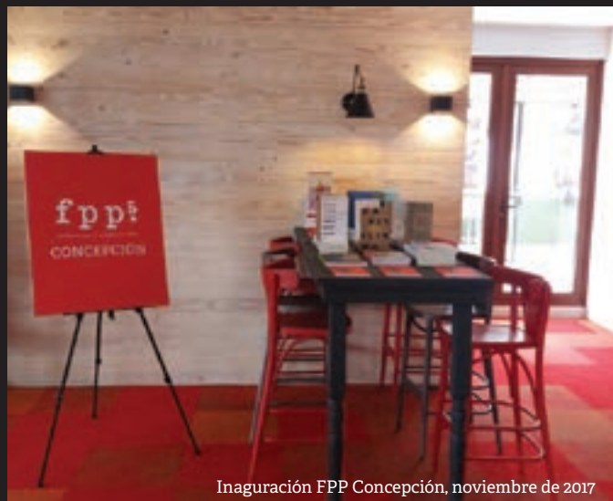
Inauguración FPP Concepción, noviembre de 2017