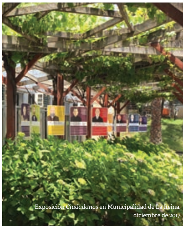
Exposición Ciudadanos en Municipalidad de La Reina, diciembre de 2017