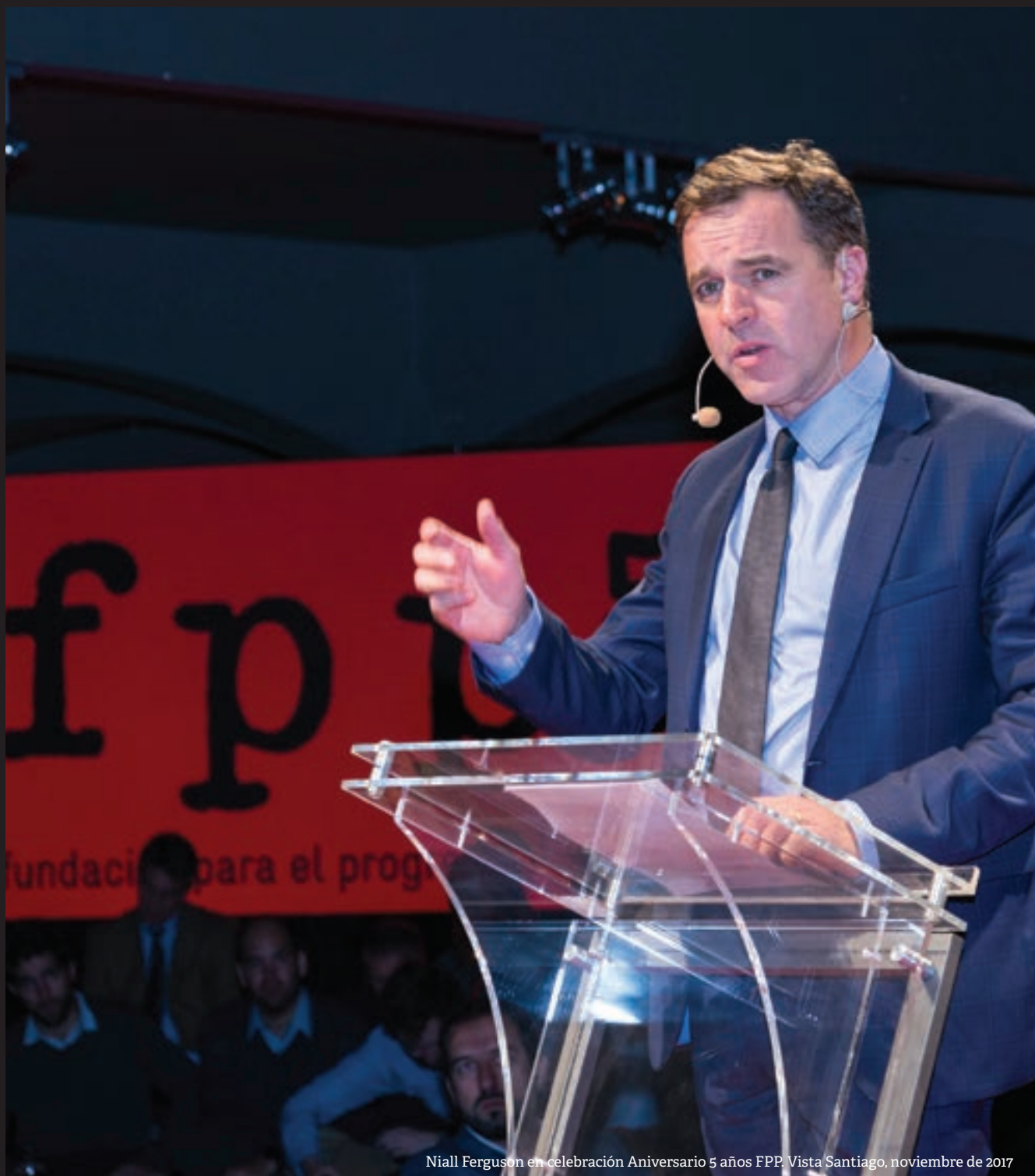
Niall Ferguson en celebración Aniversario 5 años FFP, Vista Santiago, noviembre de 2017