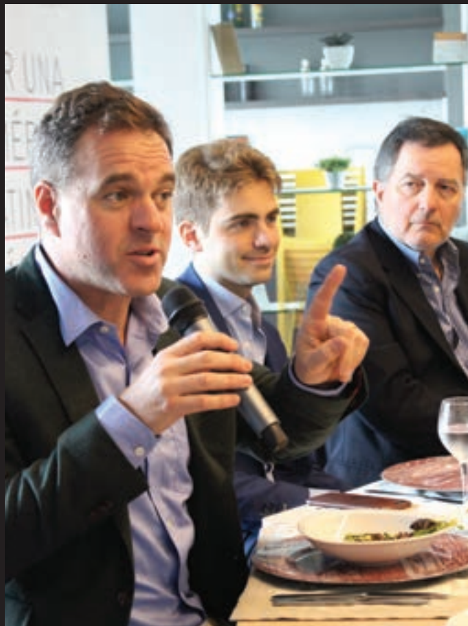
Almuerzo con Niall Ferguson, directores y editores de medios de comunicación, FPP Santiago, noviembre de 2017