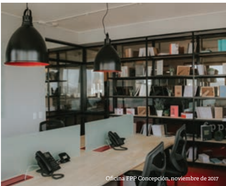
Oficina FPP Concepción, noviembre de 2017