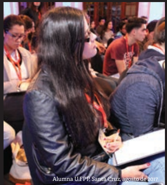
Alumna U.FPP, Santa Cruz, agosto de 2017