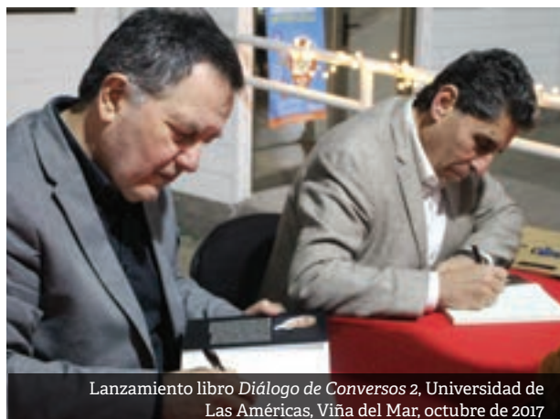
Lanzamiento libro Diálogo de Conversos 2 , Universidad de Las Américas, Viña del Mar, octubre de 2017