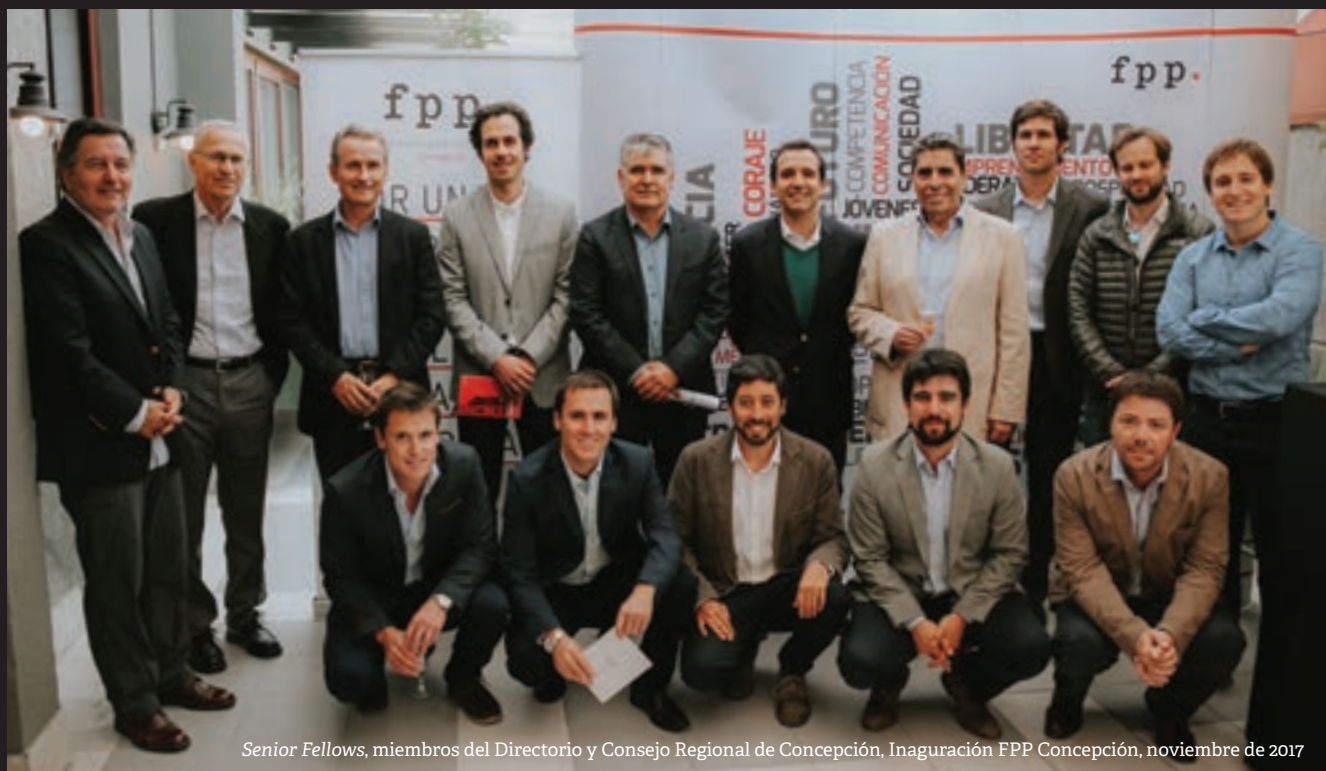
Senior Fellows, miembros del Directorio y Consejo Regional de Concepción, Inaguración FPP Concepción, noviembre de 2017